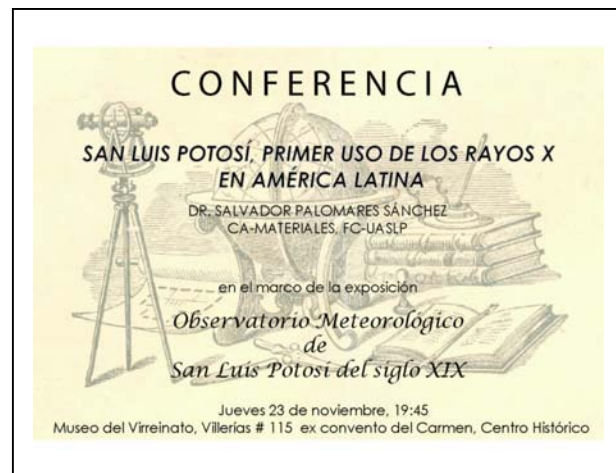
Carteles de las conferencias en el marco de la exposición, para el público en general y para niños