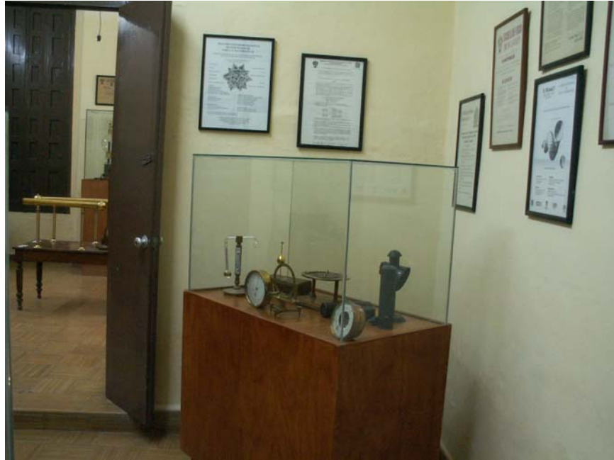
Sala Gregorio Barroeta en el nuevo Museo Casa de la Ciencia y el Juego. Aparatos del Observatorio Meteorológico del siglo XIX.

Gobierno del Estado de San Luis Potosí, Consejo Potosino de Ciencia y Tecnología y Consejo Nacional de Ciencia y Tecnología.