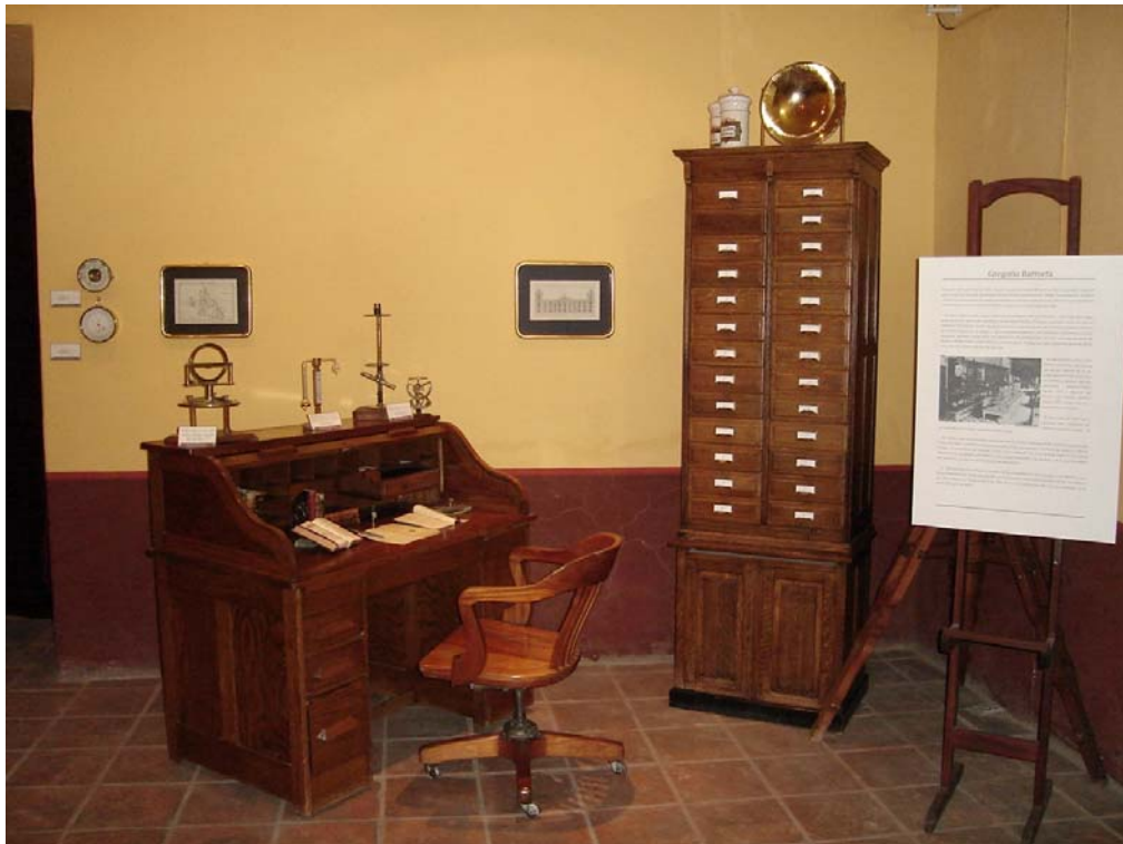
Entrada a la Exposición Observatorio Meteorológico de San Luis Potosí del siglo XIX, con motivo del Centenario de la muerte de Gregorio Barroeta.

Esta ola de importante intensidad, se caracterizó por la presencia de potosinos y otros intelectuales que llegaron a la ciudad, como el caso de José Tomás de Cuellar, iniciando la publicación de la Ilustración Potosina; de Cuellar soñaba con la estrecha relación de ciencia y poesía pero con matices que rebasaban la mera concepción positivista, de ahí que La Ilustración Potosina, se anunciara como Semanario de literatura, poesía, novelas, noticias, descubrimientos, variedades, modas, avisos. En la revista cabía la tecnología y el arte, lo útil y lo imaginativo. Tomás de Cuellar, fue un verdadero Niño Héroe que sobrevivió al ataque del Castillo de Chapultepec por las tropas norteamericanas.