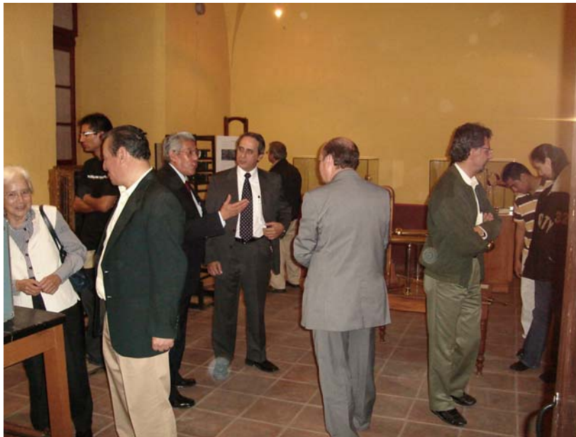
Aspecto de la inauguración de la exposición conmemorativa del centenario de la muerte de Gregorio Barroeta.

a un mínimo que requería del espíritu de nuevas generaciones que se habían formado bajo la tutela y en el ambiente de los personajes referidos.