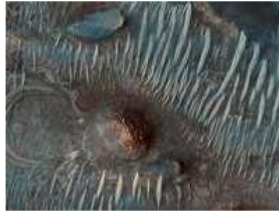
Imagen de la depresión Nili Fossae , tomada por el Orbitador de Reconocimiento de Marte. Las zonas verde y azulada representan áreas ricas en silicatos, como piroxeno y olivino. La parte rojiza está compuesta por magnesio y arcillas ricas en hierro, posiblemente formadas por agua al alterar rocas volcánicas

En análisis de muestras del suelo de Marte se hallaron nutrientes necesarios para la vida, informaron científicos de la agencia espacial estadounidense, NASA. La sonda Fénix realizó el miércoles un análisis en su laboratorio de química húmeda para medir la acidez o alcalinidad del suelo y determinar si era favorable para albergar vida. El suelo resultó ser alcalino, indicaron los expertos.