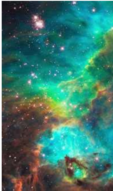
Nebulosa NGC 2074, ubicada a 170 mil años luz de la Tierra, tomada por el Hubble

Imágenes del cúmulo de galaxias de Perseo, captadas por el telescopio espacial Hubble , han ayudado a los científicos a resolver un misterio de 100 millones de años, referente a cómo se evita que se desintegren las estructuras gigantes del espacio profundo.