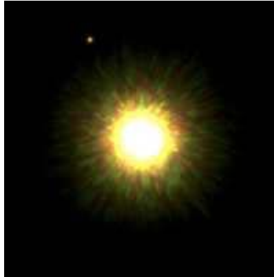
Una de las primeras imágenes del cuerpo celeste

Casi los cerca de 300 planetas llamados exoplaneta descubiertos hasta la fecha han sido detectados con métodos indirectos. Pero en esta ocasión, los científicos de la Universidad de Toronto dijeron haber usado el telescopio Gemini North de Mauna Kea, en Hawai, para tomar fotografías directas del planeta, que es más o menos del tamaño de Júpiter aunque con ocho veces su masa.