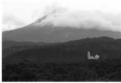
El Popocatepetl, Tochimilco, Puebla

El interés del especialista en suelos y microbiología ambiental considera que el Pico de Orizaba, el Popocatepetl y el Iztaccíhuatl, podrían responder preguntas clave sobre los procesos de evolución de la vida en el planeta.